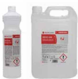
Rez a vodní kámen