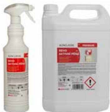
Rez a vodní kámen

Kód produktu: 800ml se zpěňovačem - 257218, 5l - 257219