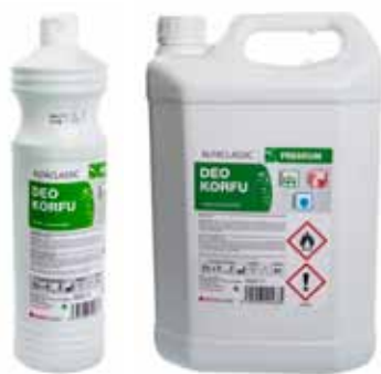
Vonný koncentrát do mycích roztoků