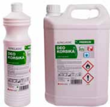
Vonný koncentrát do mycích roztoků