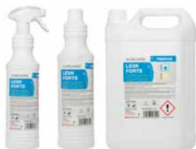
Skleněné povrchy a čištění nerez

Kód produktu: 800 ml s rozprašovačem - 259341, 800 ml s víčkem - 259342, 5l - 259343