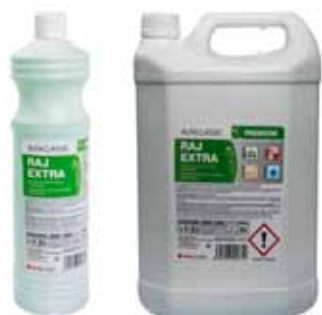
Mytí podlah a povrchů