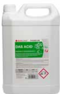
Kyselý – na vápenaté nečistoty