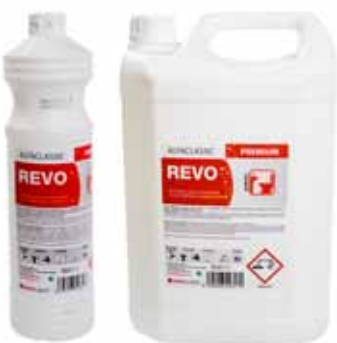
Rez a vodní kámen